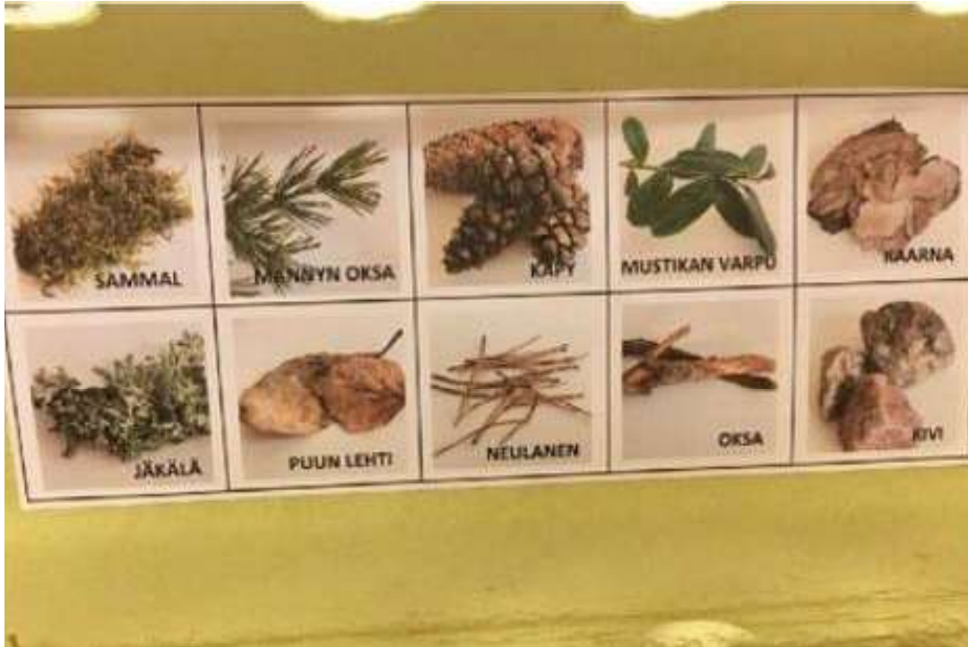
Kannen sisäpuolelle liimatut kuvat teksteineen.