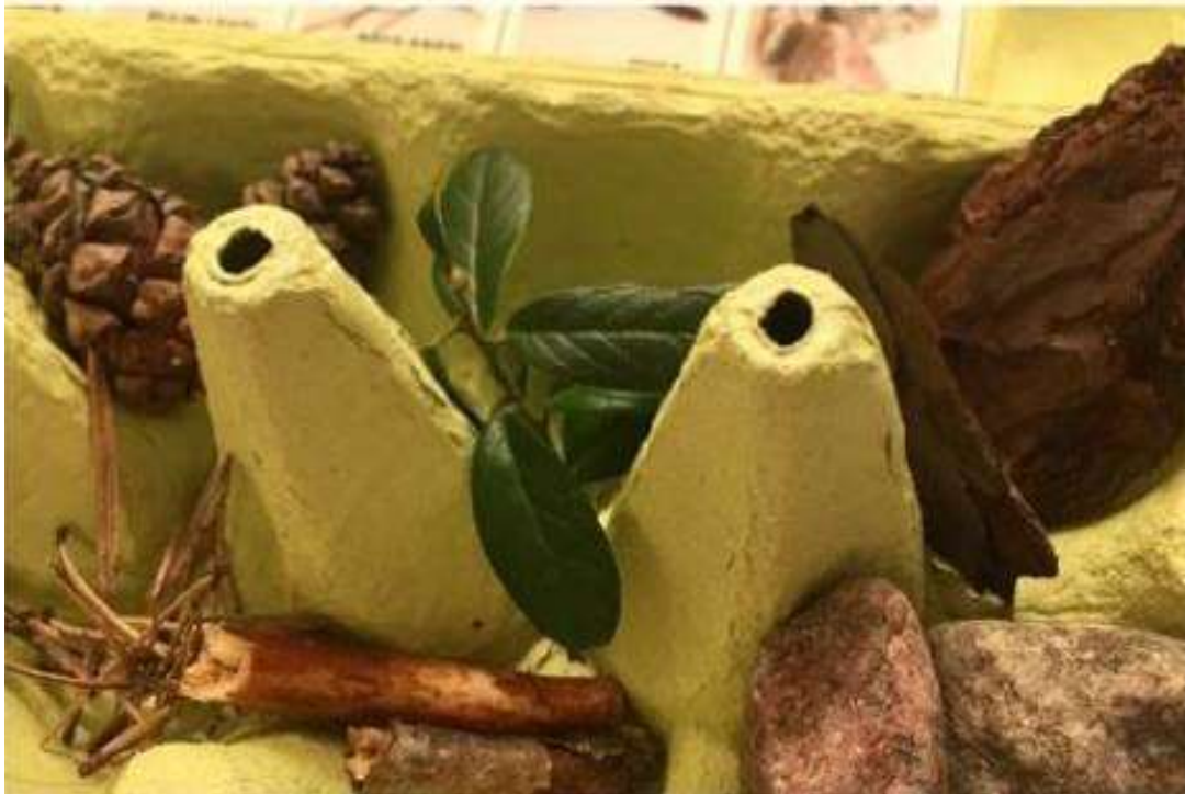
Löydettyjä luonnonmateriaaleja lokeroissaan.

Kastuneet kennot laitetaan käytön jälkeen kuivumaan seuraavaa käyttöä varten. Käytöstä poistetut keräyskennot pannaan kompostiin, mikä sopii luontoteemaan. Kerätyt luonnonmateriaalit voidaan koota lasimaljaan esille tai niistä voidaan liimata taulu.